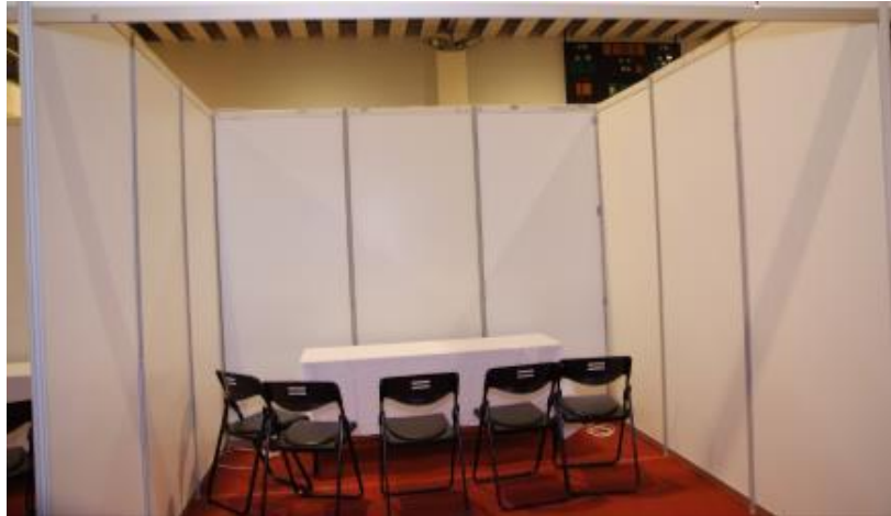
競賽區場地參考圖示

※設備保管：各隊所攜之展示設備，應自負保管責任，若有任何設備於會場遺失或毀損，大會概不負責。